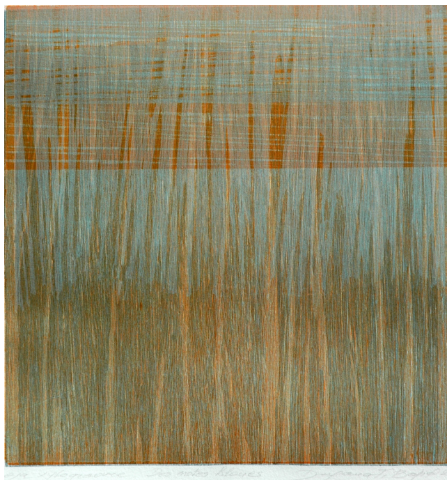
HEURE BLEUE 2, XYLOGRAPHIE ORIGINALE, 700 X 500MM, 2015